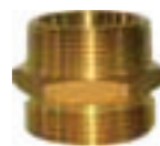
Niple de bronce 1 1/2 x 2 1/2